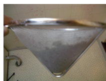
取れたカビの一部