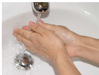
流水で洗い流します

生分解性試験結果: 99.2% 日本油料検定協会(報告書番号 Y-02523-050)