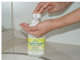
適量を手にとります