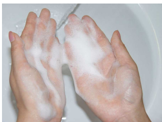
泡立たせ洗います